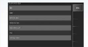
ボルシェバッテリー交換時実施項目

車検ビジネスにはバッテリー、オイル、タイヤなどの交換作業は重要です。メンテナンスモードではスキャンツール使用項目を集約しました。