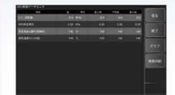
DPD関連データモニター

DPF作業完了にはひとつひとつの項目を選択し実行する必要があります。ここに改良を加え項目ごとの連携を可能にしました。強制再生簡素化を実現。