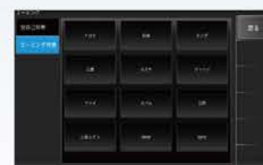
メーカー選択画面

エーミング作業の効率化を実現しました。エーミングが完了した証明証発行がPC接続と共に可能になりました。エビデンスとして保険会社への提出に役立ちます。またエーミング作業サポート、走行後のデータモニター確認など項目がまたがり面倒な作業を一連の流れで行えるようになりました。