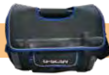
ツールバッグ (保険付き)